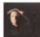
JAMES BLAKE Assume form (2019) Nuevas músicas

En el que habría sido el cincuenta aniversario de su carrera discográfica se publica esta colección obtenida de los archivos de Gallagher con grabaciones inéditas y poco comunes tocando sus canciones favoritas de blues. Este álbum revela el amor de Rory por este género a lo largo de su carrera en solitario desde 1971 hasta 1994.