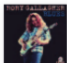
RORY GALLAGHER Blues (2019) Blues

Encontramos en el disco de este catalán frases de las que hacen pensar, pero también melodías, armonías y estribillos de los que nos hacen vibrar. Cuando ambas cosas se combinan, las canciones se vuelven mágicas y adquieren el poder de mejorar nuestra vida. Por unos minutos, al menos.