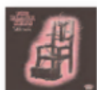
THE BLACK KEYS 'Let's rock' (2019) Rock

Disco en donde recrea su repertorio acompañado de la Orquesta Sinfónica de la Región de Murcia. "Las canciones germinan con vigor renovado y abren camino a la imaginación. La formidable máquina de la orquesta se acerca a la canción popular para exigirle vuelo poético" ha dicho su autor.