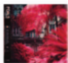
FOALS Everything not saved will be lost. Part 1 (2019) Rock

Su mejor disco, donde consiguen una maduración de su sonido en esta colección de temas que va mucho más allá de los singles. Han dejado atrás todo tipo de prejuicios en 'Oh Long Johnson', haciendo el disco de pop electrónico que antes no se hubieran atrevido según sus propias palabras.