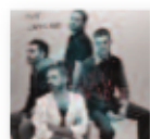
MISS CAFFEINA Oh Long Johnson (2019) Pop / Rock

Supone el lanzamiento de una de las voces emergentes más poderosas de la actualidad. A su pasión por el Soul y la música country le añade un toque contemporáneo en un tapiz sonoro tradicional de cuerdas orquestarles, violín o steel guitars. Se va a hablar mucho de ella porque son canciones espléndidas y Yola es muy, muy buena.