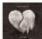
MICHAEL KIWANUKA Love & hate (2016) Soul

De entre los músicos que emergieron gracias a la fiebre del nuevo soul, al que menos le correspondía esa etiqueta era a Kiwanuka. No es en absoluto un purista. "Love & Hate" es una obra que va más allá de los géneros, sin ceñirse a un estilo único, y su calidad como compositor y vocalista es genial.