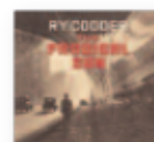
RY COODER The Prodigal Son (2018) Música popular

El pelotazo dado en los últimos años por el grupo es una de las mejores noticias sobre el buen estado del pop español. Un disco divertidísimo y también con cierto trasfondo. La amplitud de la paleta de colores da más riqueza de lo que parece a un álbum que parece decir "Todos al baile ¿No?"